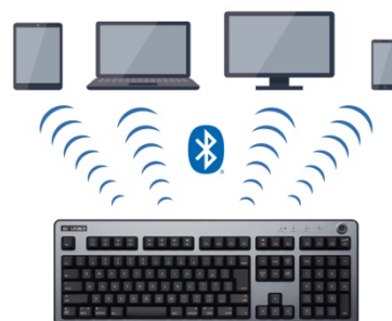
最大4台まで簡単に登録、いつでも切り替えて入力操作。 さらにUSBの有線接続もできる。